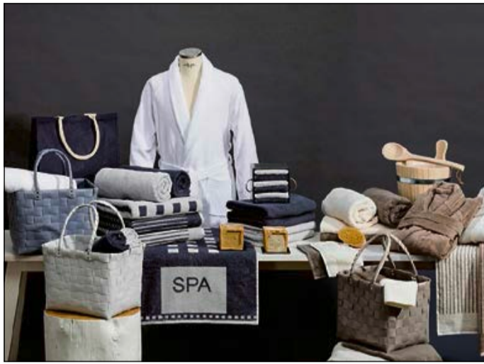
Die neue Wellness-Kollektion für einen hochwertigen Spa-Bereich.

Flauschige Velours-Bademäntel, grosszügig dimensionierte Spa-Tücher, hochwertige Tragetaschen, bequeme Badeslipper: Die neue Wellness-Kollektion von Wäschekrone lässt keine Wünsche offen und erhöht das Wohlbefinden der Hotelgäste beim Spa-Besuch. Darüber hinaus wartet auch das Frottierwäsche-Sortiment mit einer neuen Linie für das Gästebad auf, die ihren Charme einer aufwendig gewebten Bordüre