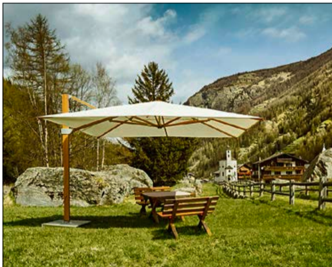
Neu von Glatz: Freiarmschirm Aura.