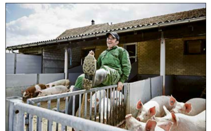
Regional erhältlich: Appenzeller Schweinefleisch.